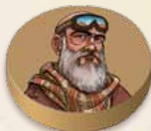
Face « Normal »

Si vous jouez avec la face « Boss » de vos pions, votre clan dispose pour la partie de 7 pions Explorateurs dont 1 avec une face « Boss » qu'on appellera le Boss.