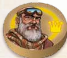
Face « Boss »